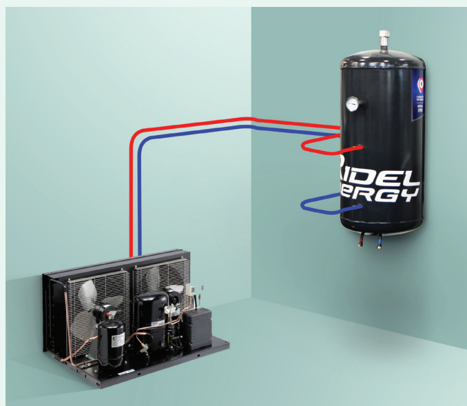
Installation sur groupe froid intérieur