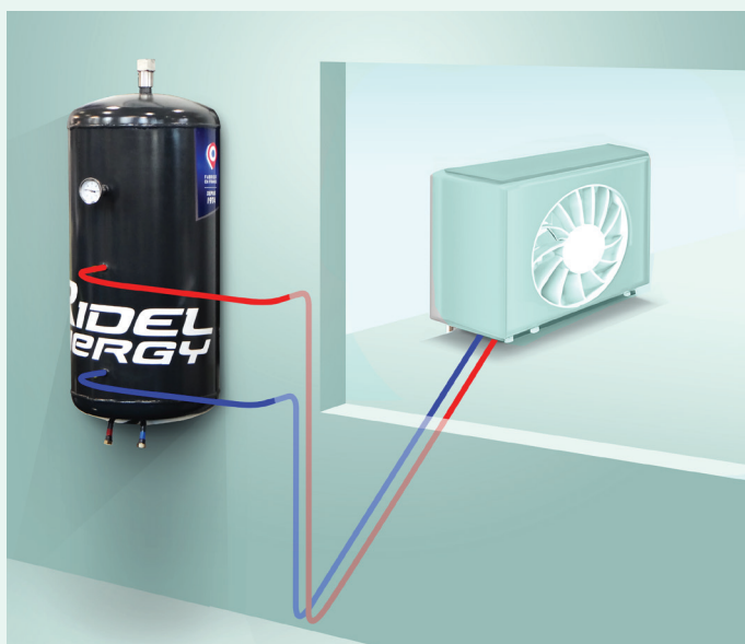
Installation sur groupe froid extérieur

(3) Coût de l'électricité : 0.25 € par kWh